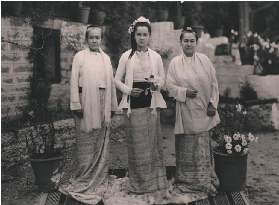
Sopra, tra zia Ma Gyi e la madre.