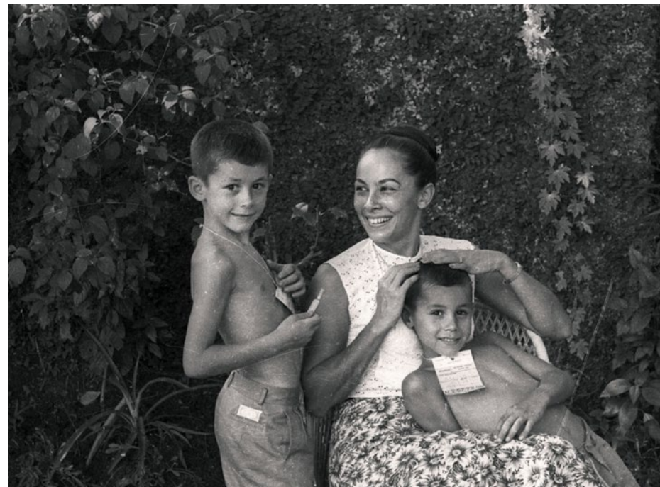
Nel giardino della casa di Manila in compagnia dei suoi figli.