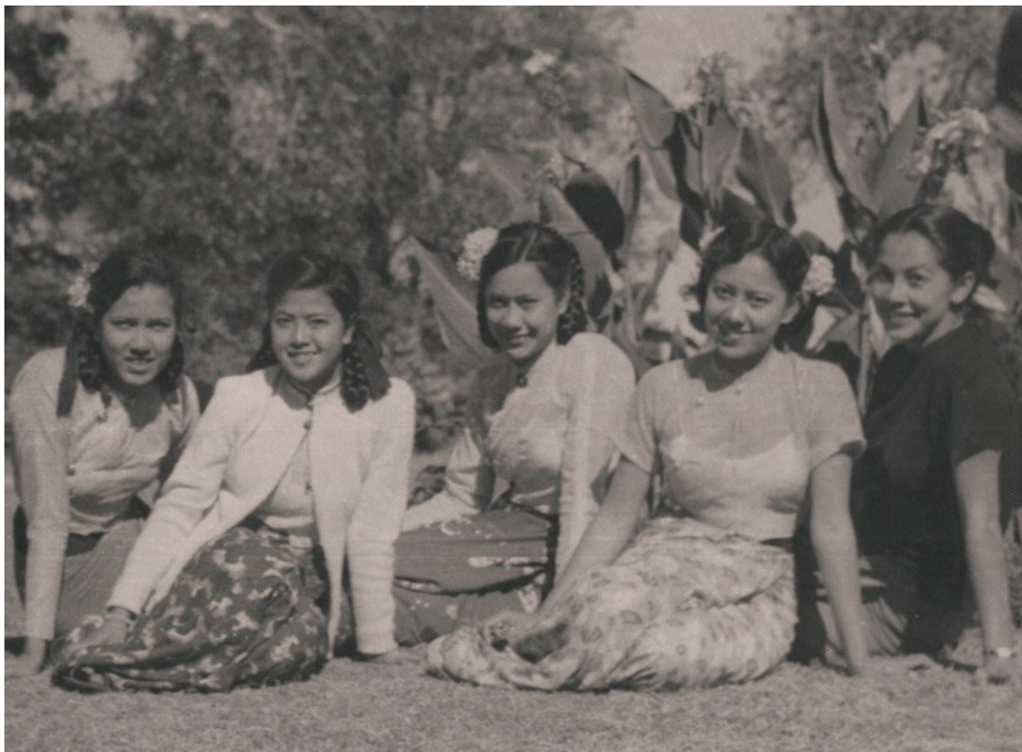
Sotto, sulla destra, con le compagne del liceo Saint Michael di Maymyo.