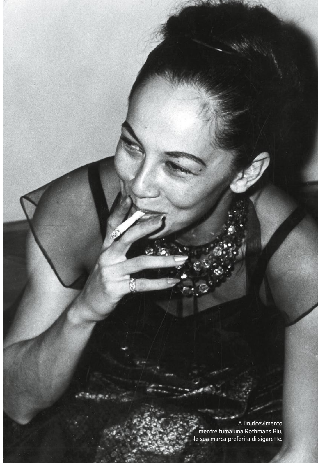
A un ricevimento mentre fuma una Rothmans Blu, le sua marca preferita di sigarette.