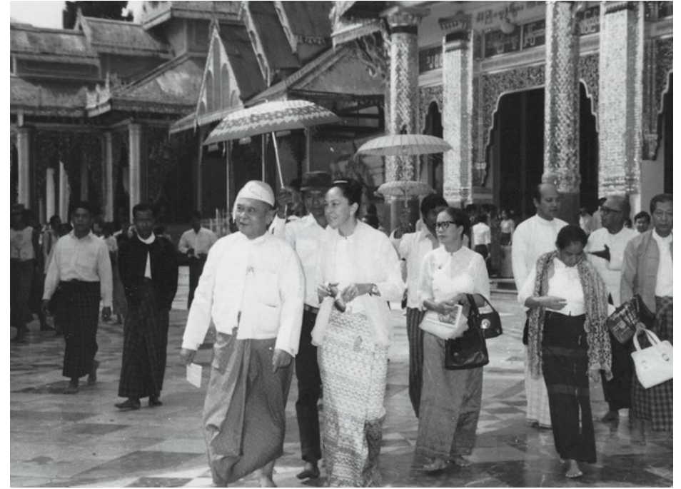
Sopra, una visita ufficiale alla pagoda Shwedagon di Rangoon.