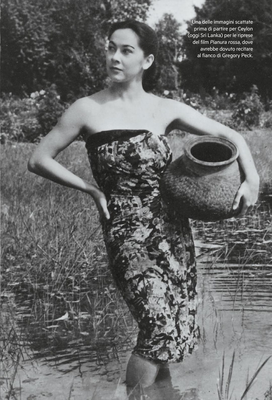
Una delle immagini scattate prima di partire per Ceylon (oggi Sri Lanka) per le riprese del film Pianura rossa , dove avrebbe dovuto recitare al fianco di Gregory Peck.