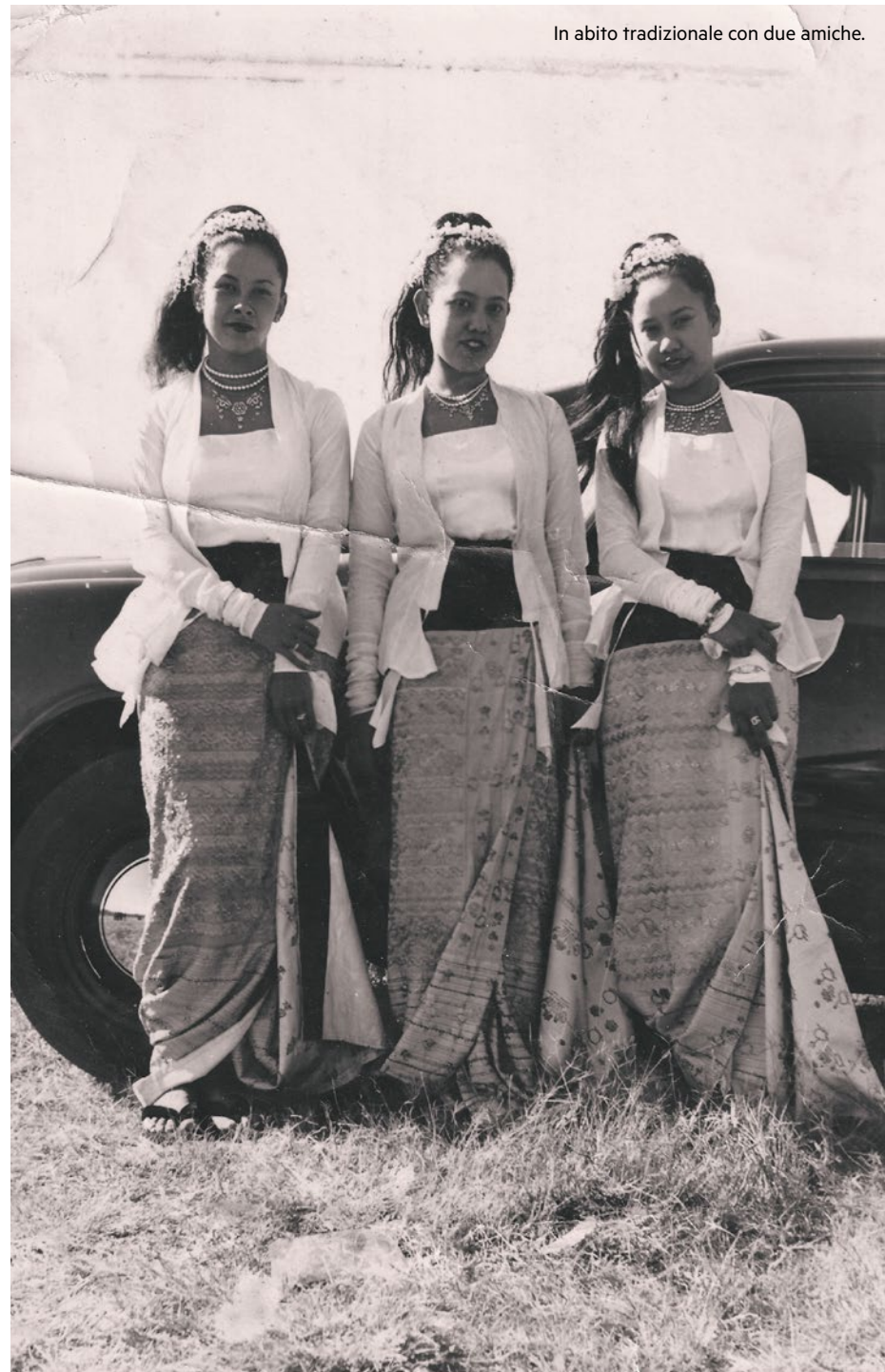
In abito tradizionale con due amiche.