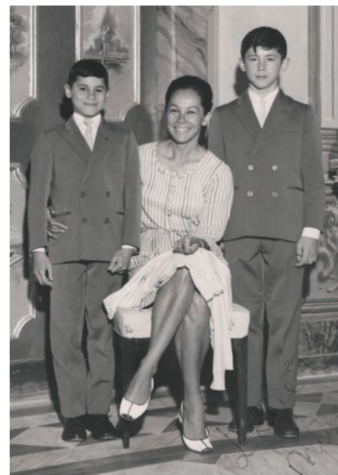
Una visita ai ragazzi al collegio della Badia di Cava dei Tirreni.