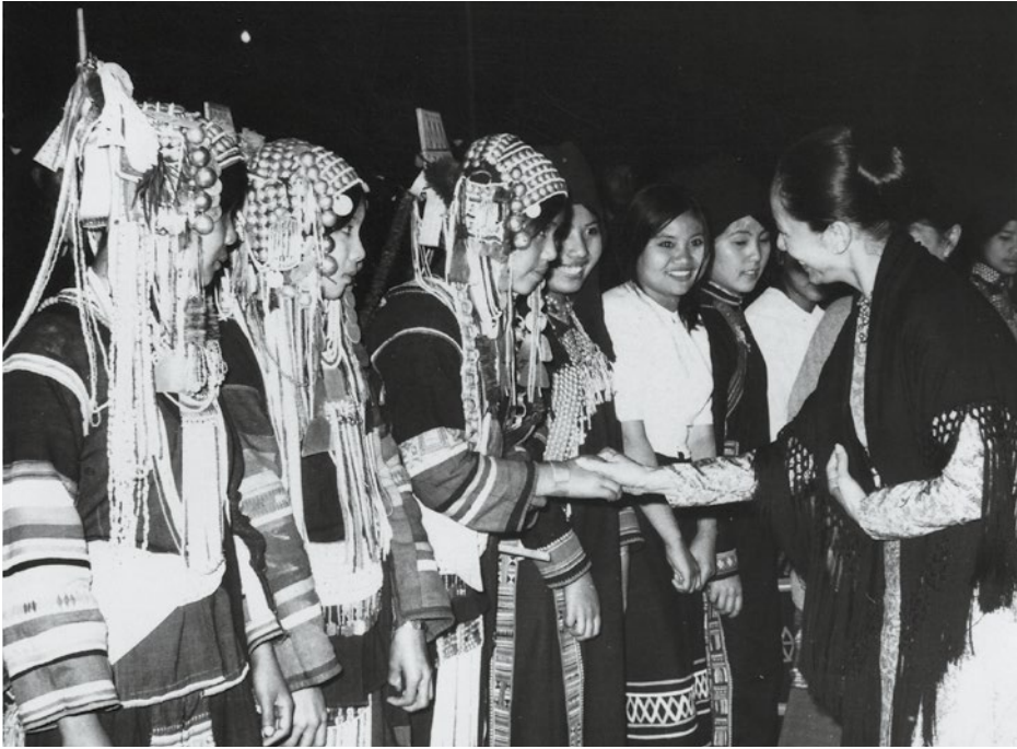
La nuova First lady incontra un gruppo di donne della minoranza shan.