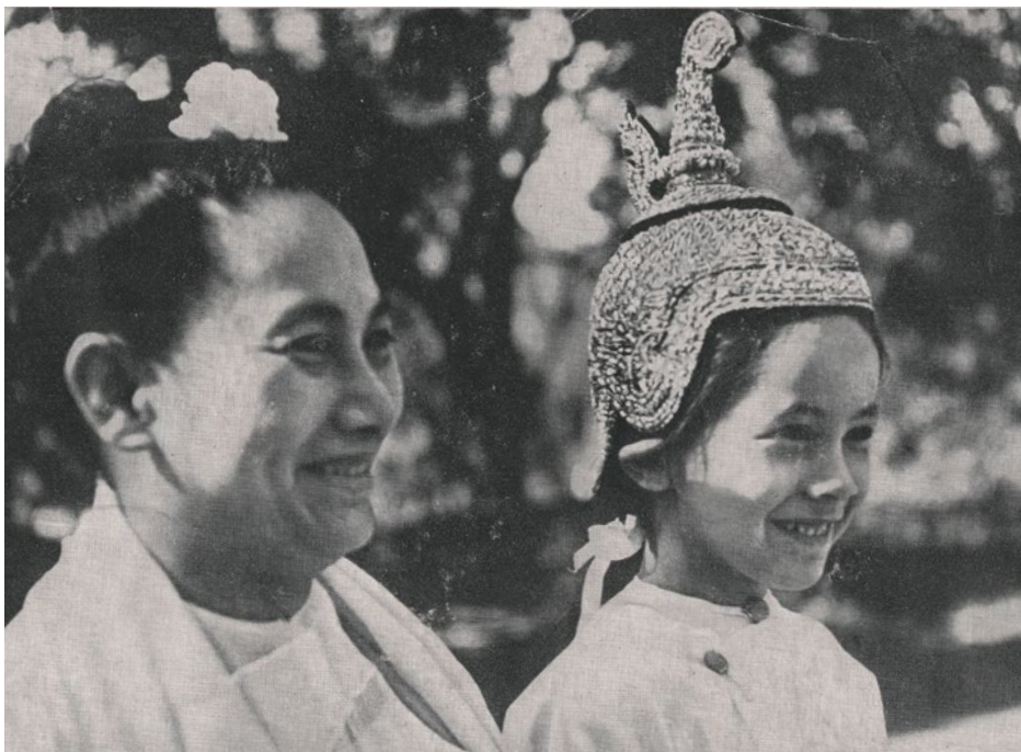
In posa insieme alla mamma indossando un seebon , un copricapo femminile ricamato tipico della Birmania.