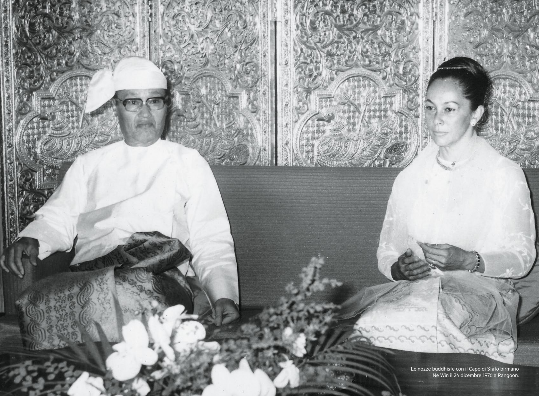
Le nozze buddhiste con il Capo di Stato birmano Ne Win il 24 dicembre 1976 a Rangoon.