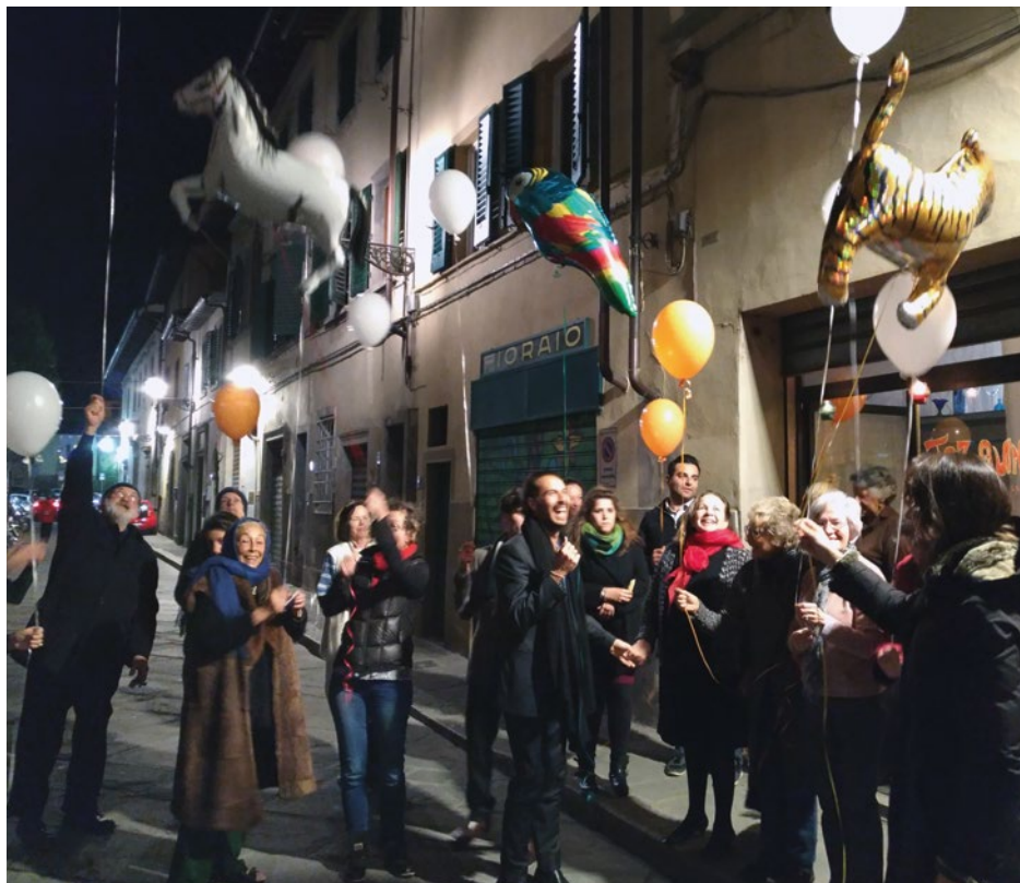
Il Tazaungdaing, la festa delle lanterne e delle mongolfiere, celebrata il 15 novembre 2016 in via di Camaldoli a Firenze.