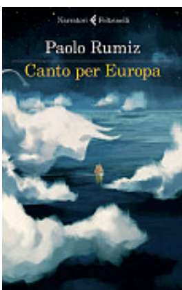
Paolo Rumiz, Canto per Europa , Feltrinelli, 256 pagine, 17 €

Esplorare culture, perlustrare città, indagare luoghi e paesaggi. Per andare alle radici della propria storia, capire il presente, tracciare una rotta per il futuro