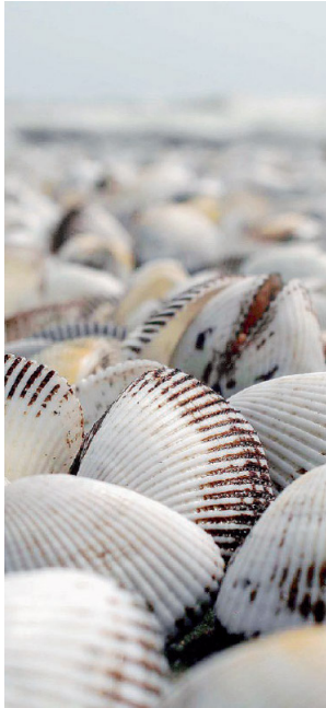
Spiaggiate Conchiglie bianche

SOTT'ACQUA Il biologo Chauvaud racconta vita, morte e miracoli della "Sentinella dell'oceano", da San Giacomo alla "Venere" del Botticelli, al cammino di Santiago