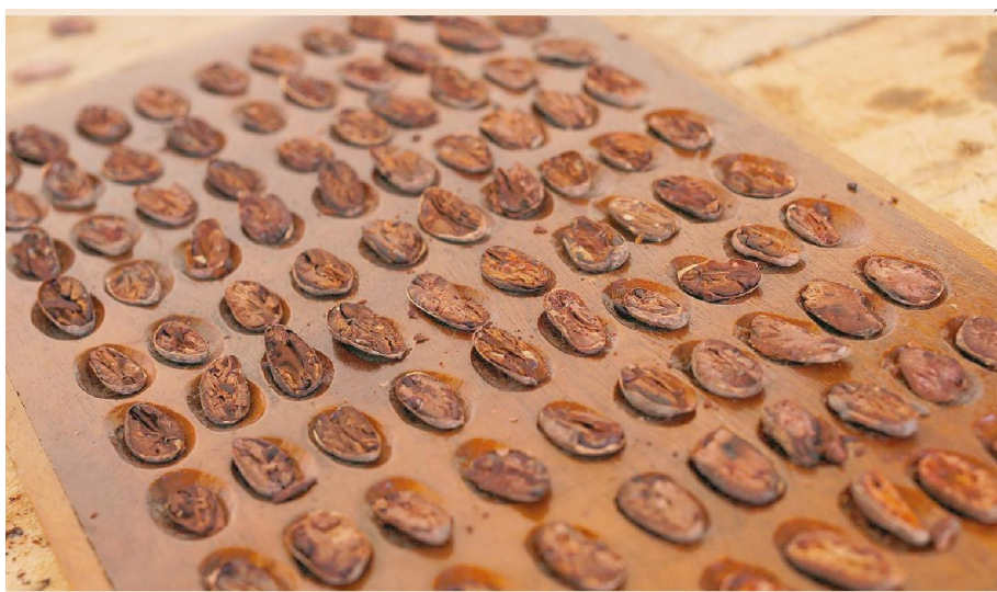
Brasile. Semi di cacao tostati. Ogni anno si consumano circa 2 chilogrammi a testa in Europa di cioccolato e 1,3 in America, ma soltanto 12 grammi in Asia e 14 in Africa, dove il consumo non ha preso piede. Record mondiale per la Svizzera.