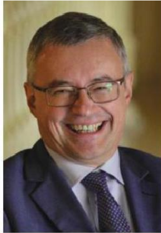
Il professor Alessandro Barbero