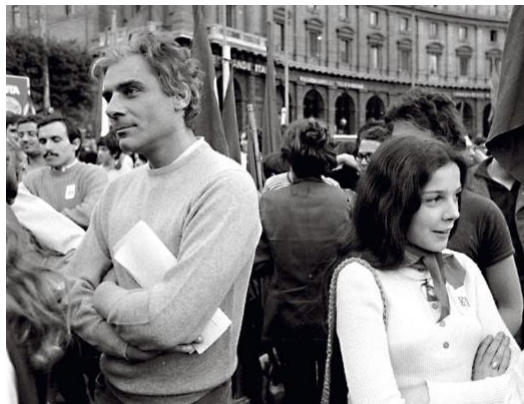
ROMA, 1971: GIAN MARIA VOLONTÉ A UN COMIZIO DEL PARTITO COMUNISTA ITALIANO IN PIAZZA DELLA REPUBBLICA