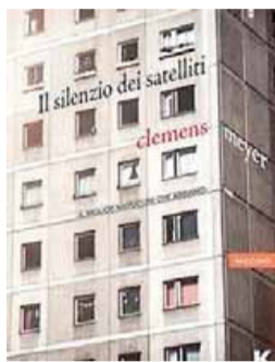
Il silenzio dei satelliti | Clemens Meyer Keller editore | 223 pagine | 16,50 euro

guardando il Mar Baltico e un fantino fallito col sogno di gareggiare sul lago ghiacciato... Battaglie perse e desideri travolgenti, le mille facce del nostro tempo: immigrazione e povertà, disagio e sofferenza, amore e speranza.