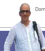
A cura di Carlo Martinelli