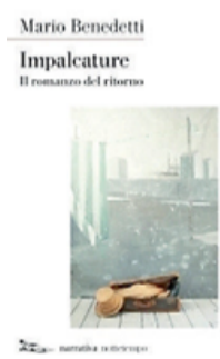
Impalcature | Mario Benedetti I nottetempo editore | 329 pagine | 16 euro