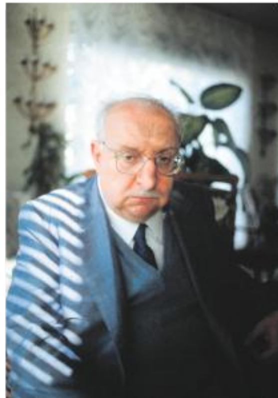
NOTE Giorgio Manganelli (Milano, 1922 - Roma, 1990)

Una chicca del volume, in questa nuova edizione, sono i cinque articoli a tema musicale che Manganelli scrisse fra il 1976 e il 1989: Seviziato e luminoso su un concerto di Severino Gazzelloni (flautista del quale, quest'anno, ricorre il centenario), Enigma della superficie su Alberto Savinio, Genio scostante su Paradiso perduto di Penderecki da testo di Milton, Esorcismi di carta sulla notazione dalla polifonia cinquecentesca di Luzzaschi alle sperimentazioni di Stockhausen, Niente da dire sull'«assenza di idee» nella musica. Lui, invece, di idee sulla musica ne aveva parecchie. Una profonda invidia per Manganelli.