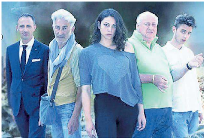
Alcuni degli interpreti del film