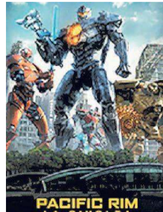
La locandina del film Pacific 2

Il conflitto che ha coinvolto il nostro pianeta tra mostri alieni e super macchine pilotate dall'uomo e costruite per annientarli è stato solo il preludio ad un nuovo devastante assalto nei confronti dell'umanità. Il ribelle Jake Pentecost, un tempo promettente pilota Jaeger il cui leggendario padre diede la vita per assicurare la vittoria dell'uomo sui mostruosi "Kaiju", decide di abbandonare il suo addestramento, per ritrovarsi coinvolto nel mondo della criminalità... Film fantascienza