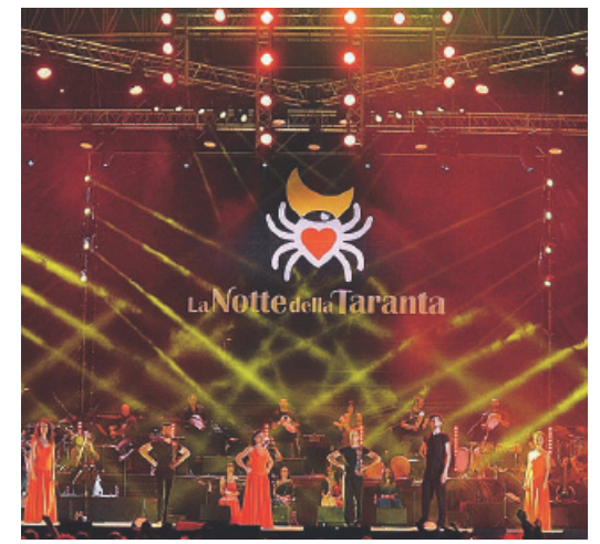
«NDT» L'orchestra della «Notte della Taranta» questa sera a Leuca