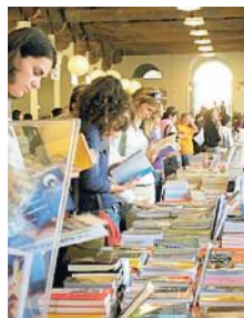
Un'edizione passata del “Pisa Book Festival”