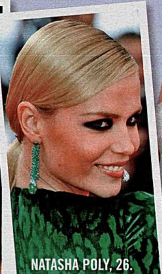
NATASHA POLY, 26.