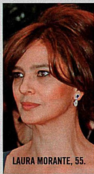
LAURA MORANTE, 55.