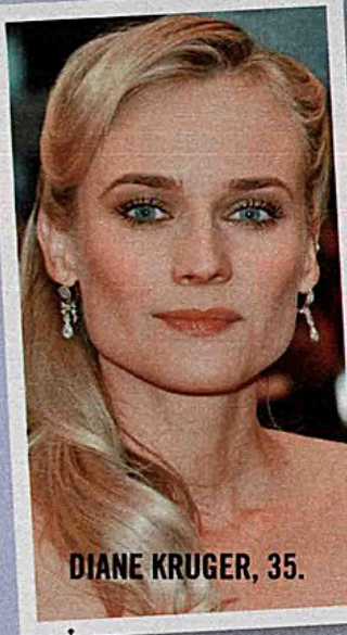
DIANE KRUGER, 35.

LISCI, ONDULATI O RICCI. CON LE DOPPIE PUNTE, SFIBRATI O POCO LUMINOSI. PER OGNI PROBLEMA C'È LA SOLUZIONE