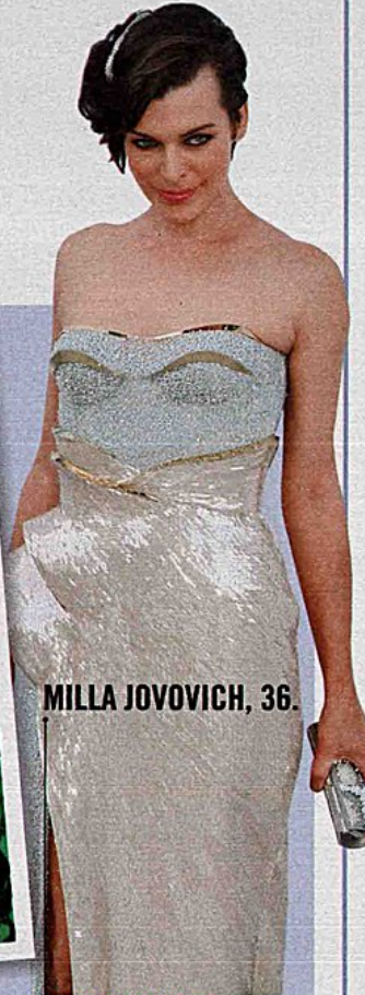
MILLA JOVOVICH, 36.