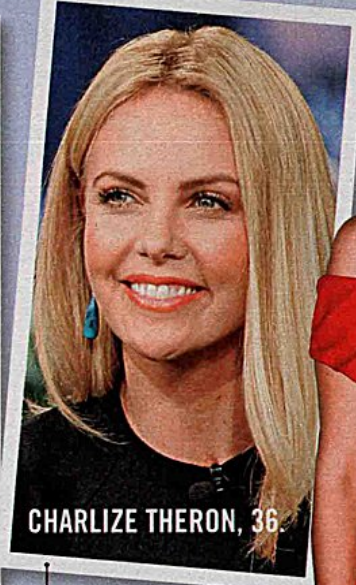
CHARLIZE THERON, 36.